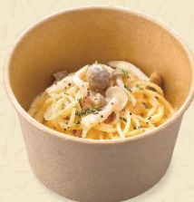
106. しめじの 明太クリームパスタ