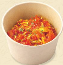
103. セミドライトマトと モッツアレラチーズのトマトソース 🍴