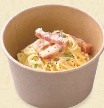
110. グリルベーコンの クリームパスタ