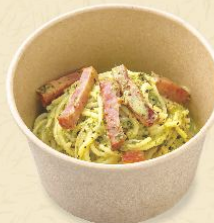
111. グリルベーコンの ジェノベーゼクリームパスタ