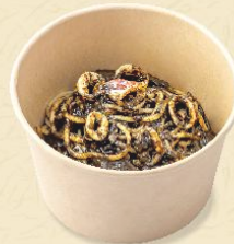
105. やりのいかのいかすみ トマトソース 🍴 🍷