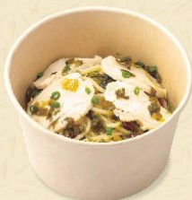
101. 桜姫鶏と高菜の ピリ辛おだしパスタ 🍴 🌶️