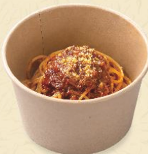
109. ボロネーゼ 🍴