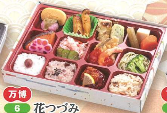
万博 6 花つづみ 29×20cm