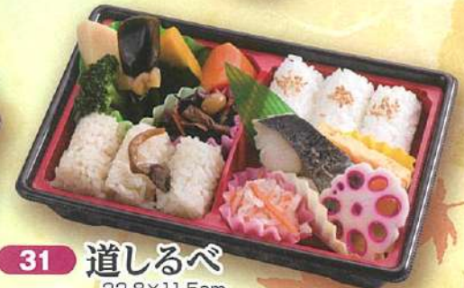
31 道しるべ 22.8×11.5cm