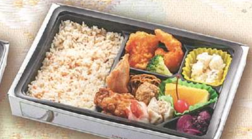
45 中華三昧弁当 27.5×18cm