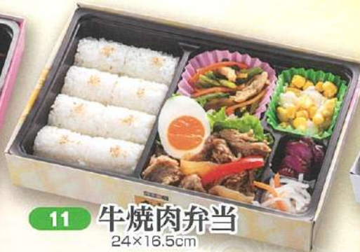
11 牛焼肉弁当 24×16.5cm