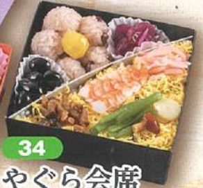
34 やぐら会席 13×13cm×3段