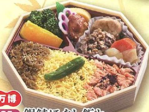
万博 25 銀鮭ほぐし飯と 但馬牛の味くらべ 18.5×18.5cm