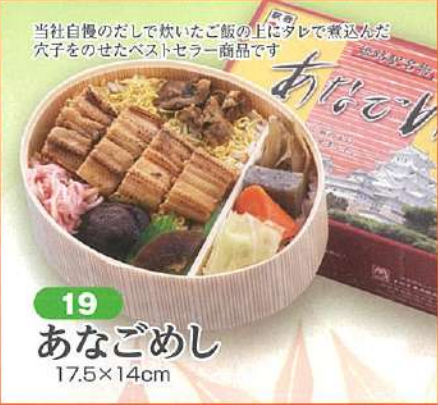
19 あなごめし 17.5×14cm