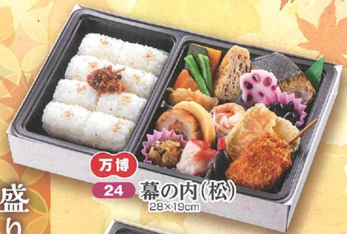
万博 24 幕の内(松) 28×19cm