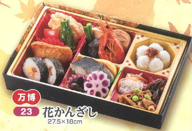
万博 23 花かんざし 27.5×18cm