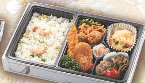
44 洋風ピラフ弁当 27.5×18cm