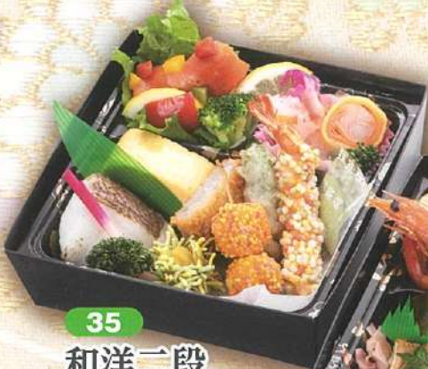
35 和洋二段 幕の内風月

[上段] 22.6×22.6cm [下段] 21.1×21.1cm [二重高さ] 9.3cm