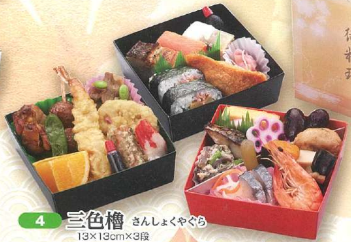
4 三色櫓 さんしよくやぐら 13×13cm×3段