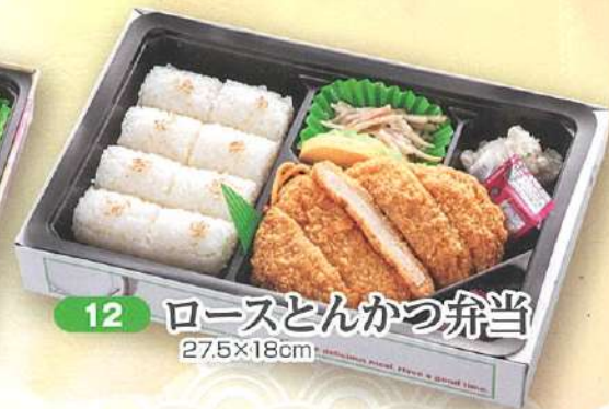
12 ロースとんかつ弁当 27.5×18cm