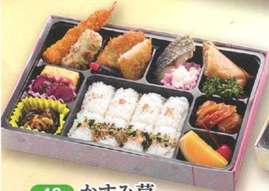
10 かすみ草 27.5×18cm