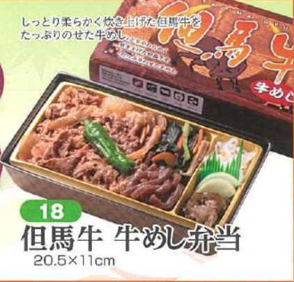
18 但馬牛 牛めし弁当 20.5×11cm