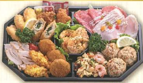
50 洋風オードブル 36×24cm