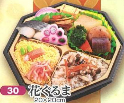
30 花ぐるま 20×20cm