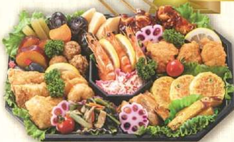
49 和風オードブル 36×24cm