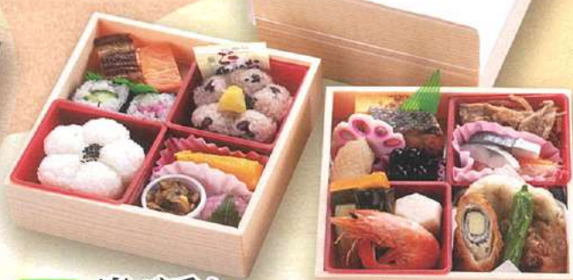
2 慶び重ね 喜食満面(5.5寸) きしよくまんめん 16.5×16.5cm×2段