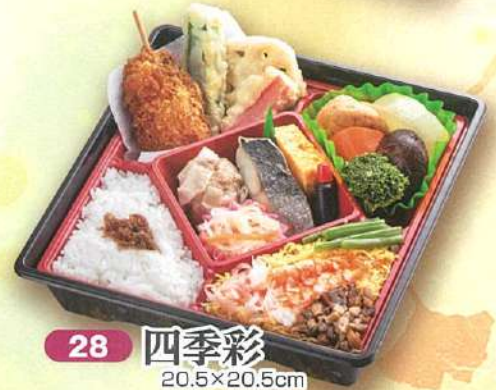
28 四季彩 20.5×20.5cm