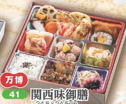
万博 41 関西味御膳 24.5×24.5cm