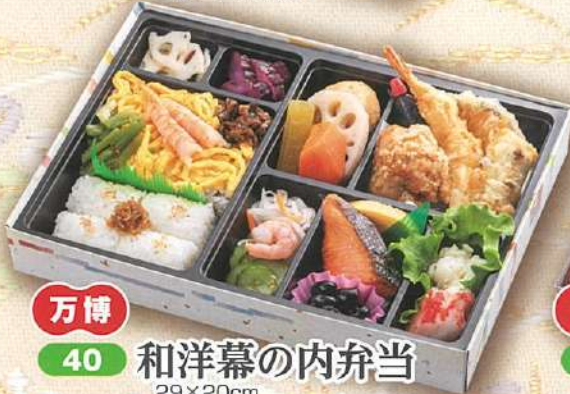
万博 40 和洋幕の内弁当 29×20cm