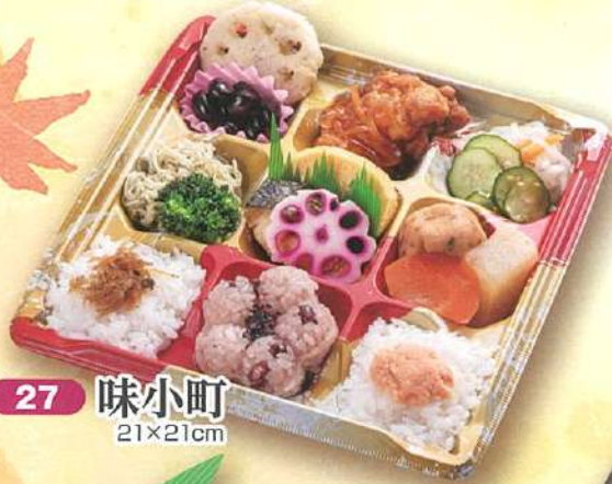
27 味小町 21×21cm