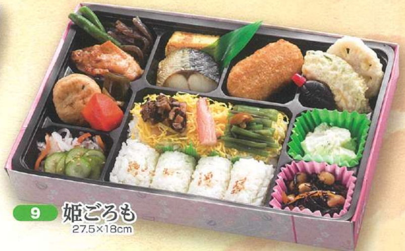
9 姫ごろも 27.5×18cm