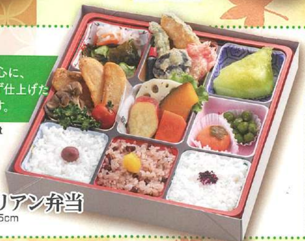
万博 33 ベジタリアン弁当 24.5×24.5cm