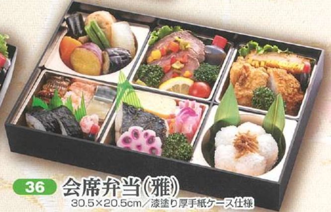
36 会席弁当(雅) 30.5×20.5cm / 漆塗り厚手紙ケース仕様