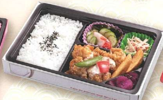
14 チキン南蛮弁当 27.5×18cm