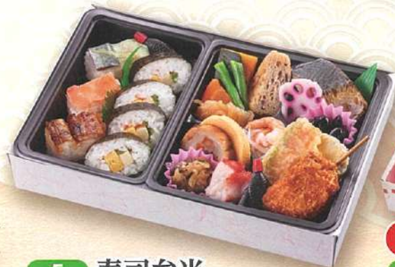
5 寿司弁当 28×19cm