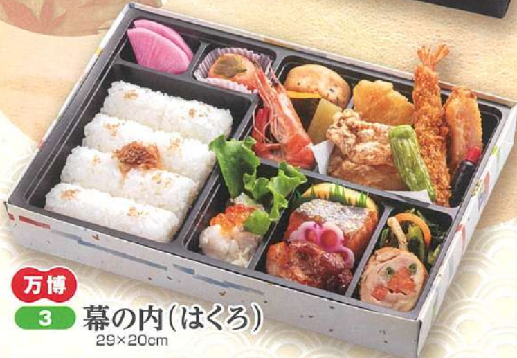
万博 3 幕の内(はくろ) 29×20cm