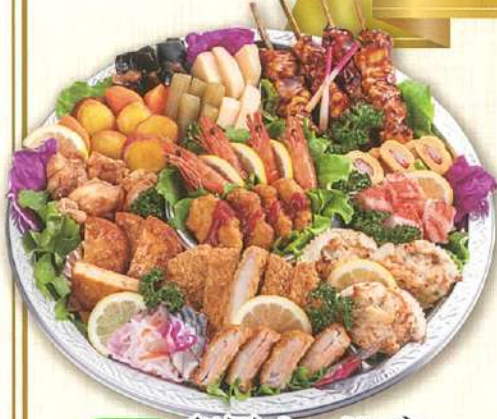
46 和風オードブル 直径40cm(5~7名盛)