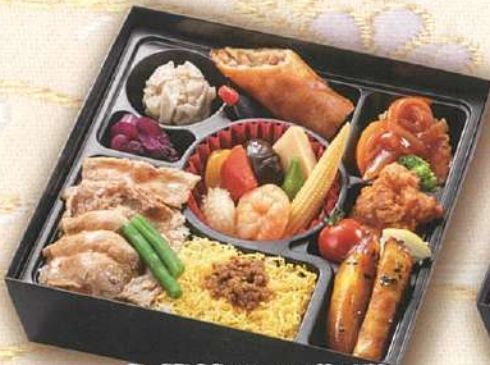
37 中華餡かけ御膳 21.5×21.5cm