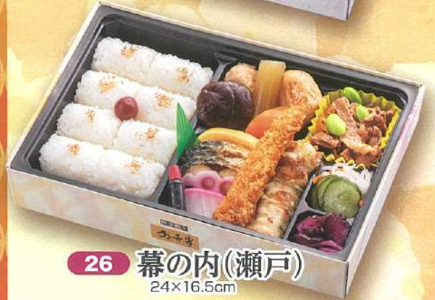
万博 26 幕の内(瀬戸) 24×16.5cm