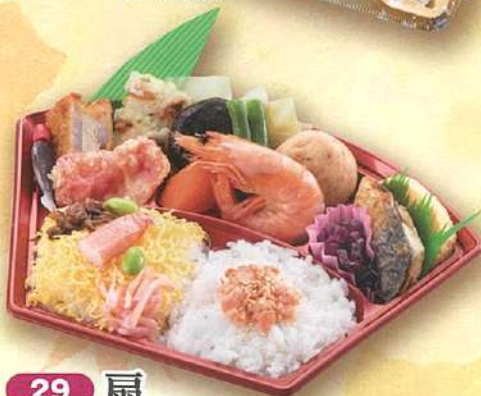
29 扇 24×13cm