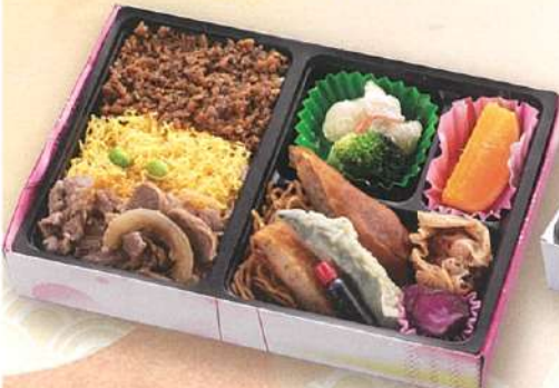
13 肉めし三色弁当 24×16.5cm