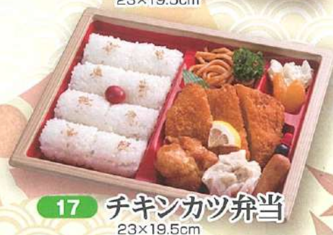
17 チキンカツ弁当 23×19.5cm