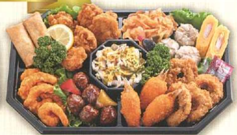
51 中華オードブル 36×24cm