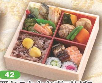
42 栗おこわとお寿司目和 16.5×16.5cm