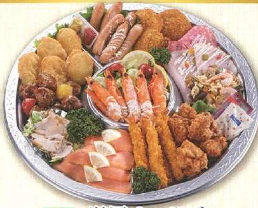
47 洋風オードブル 直径40cm(5~7名盛)