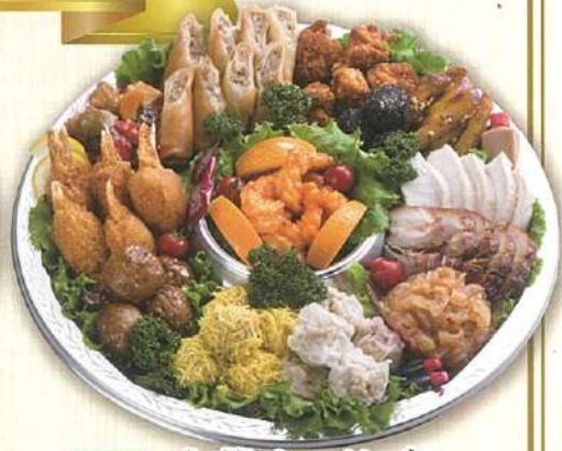
48 中華オードブル 直径40cm(5~7名盛)