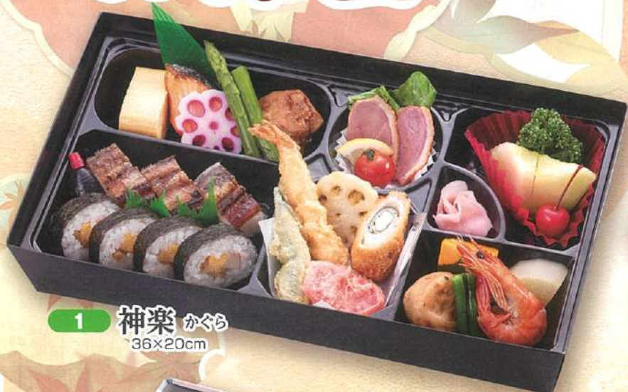
1 神楽 かぐら 36×20cm