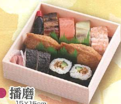
32 播磨 15×15cm