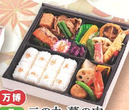
万博 7 二の丸 幕の内 24.5×24.5cm