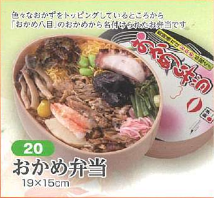
20 おかめ弁当 19×15cm