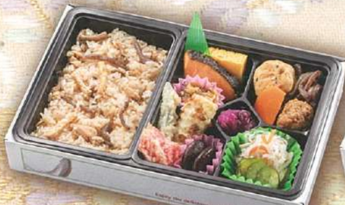
43 かやくご飯と銀鮭の 幕の内弁当 27.5×18cm