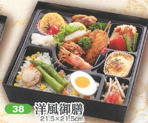
38 洋風御膳 21.5×21.5cm