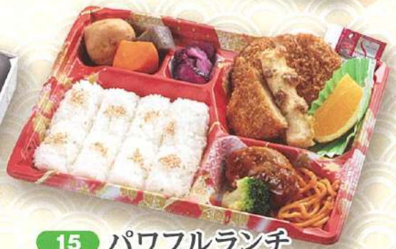
15 パワフルランチ 27×20cm