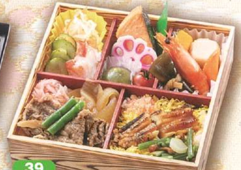
39 但馬牛と穴子ちらし膳 18×18cm