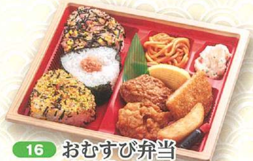
16 おむすび弁当 23×19.5cm