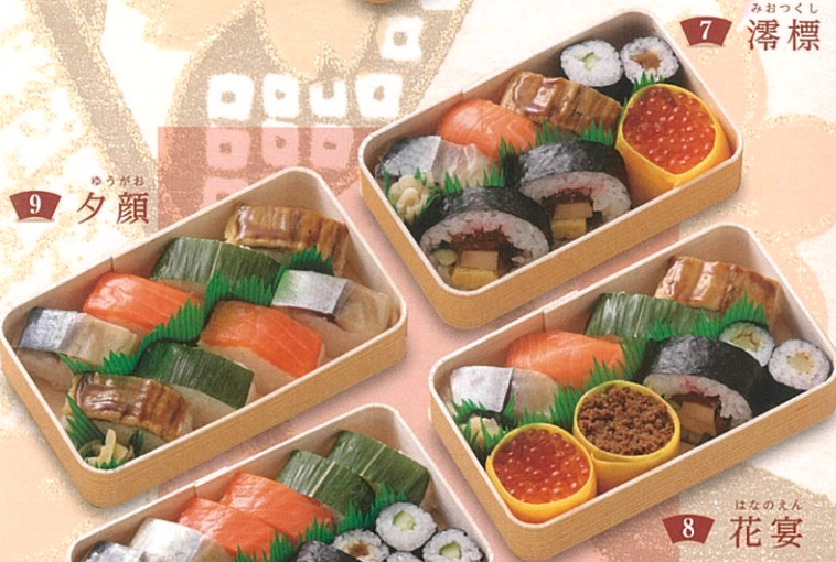
7 濔標 みおつくし