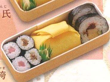
6 藤袴 ふじばかま