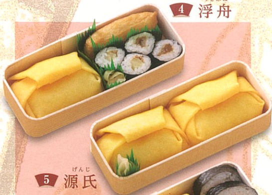
5 源氏 げんじ